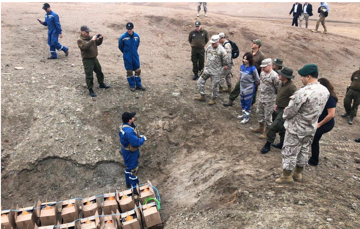
Figura 1: “Visita de Subsecretaria de Bienes Nacionales y otras autoridades a actividades de destrucción de FAMA E.”

Considerando que las Fábricas y Maestranzas del Ejército (FAMA E), en el ejercicio de las actividades previstas en su Ley Orgánica D.F.L. N°223, de 1953, Ley Orgánica de las Fábricas y Maestranzas del Ejército, cuyo texto refundido, coordinado y sistematizado fue fijado por Decreto Supremo N°375, de 28 de diciembre de 1978, estipula que requiere el establecer capacidades y estrategias de desarrollo para la producción de elementos bélicos y servicios relacionados, que cubran las necesidades de la Defensa Nacional. Y que asimismo, dentro del desarrollo dual de capacidades, en el sentido de que el servicio de desmilitarizado que las fábricas presta al Ejército de Chile, es de utilidad para otros organismos del Estado, como lo es la destrucción de elementos de decomiso, fue necesario explorar nuevas alternativas que permitan satisfacer esta necesidad (Decreto Supremo N°375, 1978).