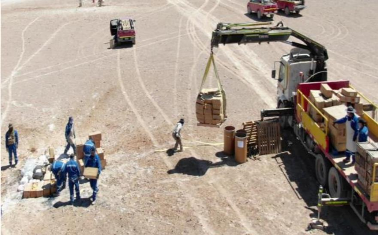
Figura 9: “Destrucción de elementos pirotécnicos decomisados por la Dirección General de Movilización Nacional.”

pirotécnicos, decomisados por la Dirección General de Movilización Nacional (DGMN), en terrenos de FAMA E en la ciudad de Antofagasta” (FAMA E, 2020 p.17).