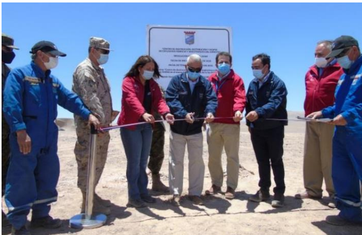
Figura 8: “Inauguración de Centro de distribución, acopio y destrucción de residuos explosivos.”

Este terreno permite la destrucción no solo de explosivos sino también de excedentes de la gran minería, respetando todas las normas medioambientales y de seguridad” (FAMAE, 2020 p.17).